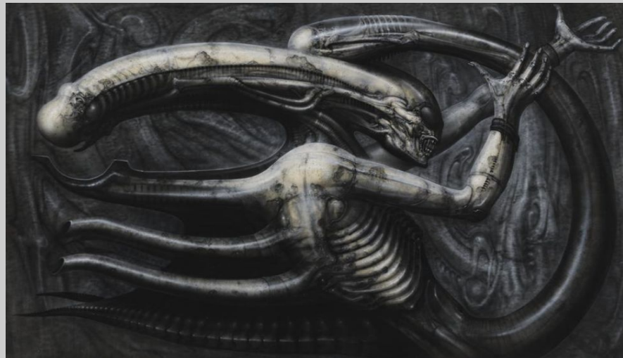
Necronomicon IV (1976), H.R. Giger