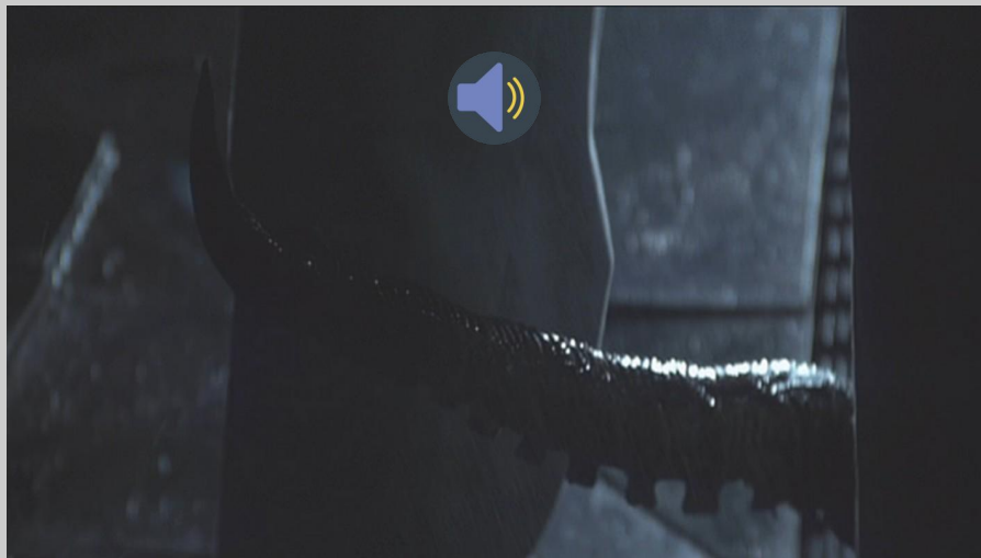
Alien : agression de Lambert

Ridley Scott met en scène plusieurs agressions comme des scènes de viol. Analysez les deux photogrammes proposés.