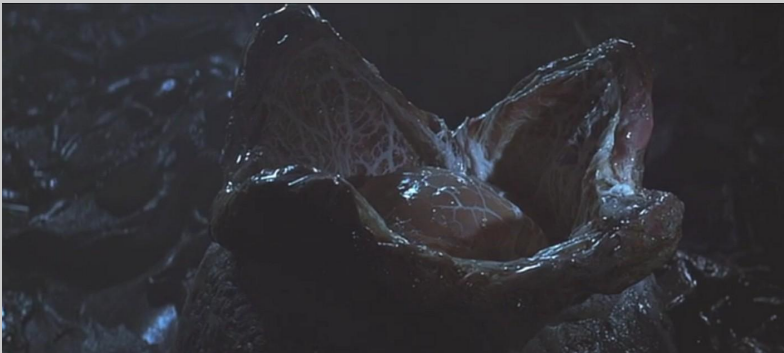
Oeuf de l'Alien