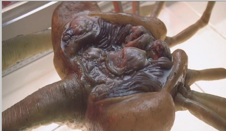
Facehugger : "Enlaceur de visage"