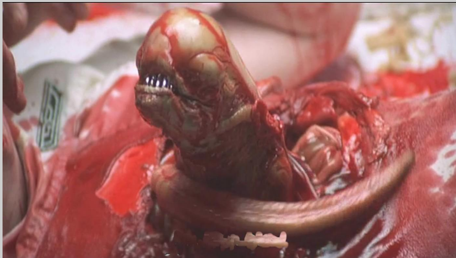
Chestbuster : "Exploseur de thorax"

Le Chestbuster perfore l'abdomen de Kane dans une scène d'accouchement terrifiante. Qu'évoque l'aspect de la dépouille du facehugger après avoir assuré la nutrition de l'embryon monstrueux ?