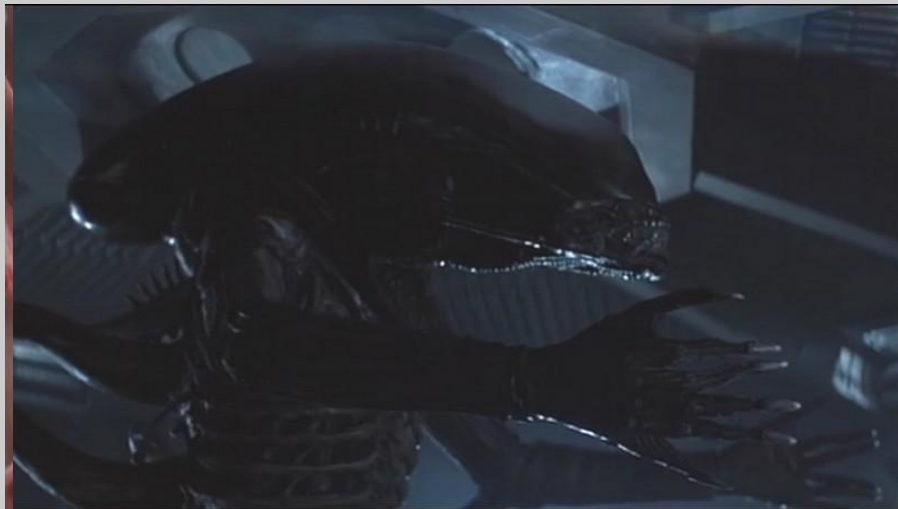
Alien : agression de Lambert

L'Alien a été conçu par l'artiste suisse H.R. Giger, concepteur d'un univers plastique peuplé de créatures biomécaniques et traversé par une sexualité morbide. Que symbolise le monstre ?