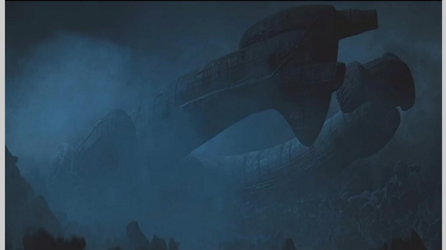
Plan d'ensemble sur le vaisseau